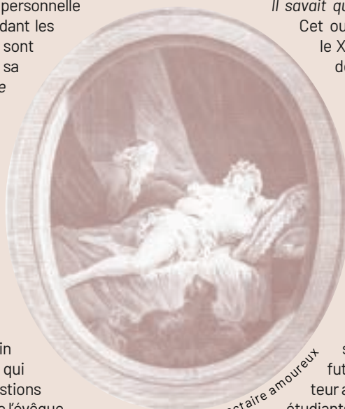
Le réfractaire amoureux

La mortification y est prévue : « résolution 21 : je tâcherai en mortifiant en tout ma volonté, de mortifier ainsi mes sens, les yeux, les oreilles la langue, le goût et l'odorat ». Le but de cette éducation y est clairement exprimé : « Modèle d'obéissance et de soumission envers ses parents et ses supérieurs, Sousi ne se contentait pas de suivre leur volonté, il étudiait leurs désirs et les prévenait.