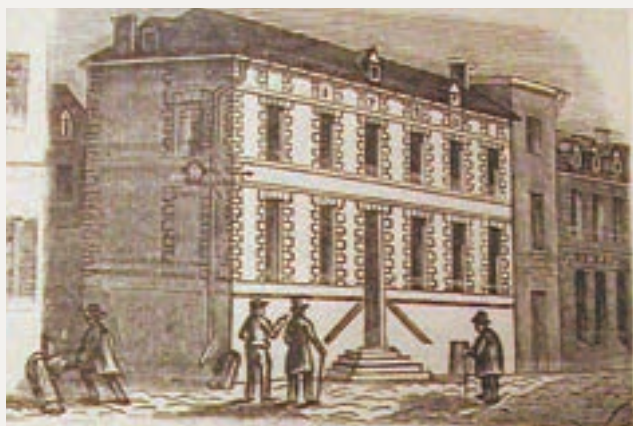
Maison de Robespierre à Arras (vue ancienne)

Dans les années 1780, Arras était une ville densément peuplée de vingt mille habitants, fourmillant d'activités bien définies dans chaque petit quartier : les paroisses prospères de la noblesse et de la bourgeoisie ; les rues ouvrières situées le long des bras pollués de la rivière Scarpe et de son affluent, le Crinchon ou encore la citadelle de l'armée. En tant que capitale de l'Artois, Arras comprenait aussi une « ville » distincte, qui regroupait les édifices de l'administration, de l'Église et de la magistrature 1 . À l'exception de la nouvelle « ville basse » achevée en 1780, Arras était encore ceinte de ses remparts. Le vieil Arras restait une ville médiévale, avec son réseau de rues étroites et sombres qui entouraient ses grands axes et ses deux places centrales.