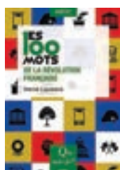
Hervé Leuwers Les 100 mots de la Révolution Française Que sais-je 2025