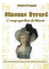
Stefania Di Pasquale Simonne Evrard Édition à frais d'auteur sur Amazon (voir site)