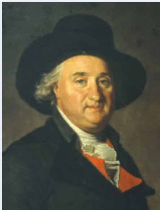
Dubois de Fosseux

Comme nombre de ses contemporains, Robespierre n'a pas attendu 1789 pour apprendre la politique ; dès ses mémoires judiciaires (factums), ses écrits académiques, ou son refus de la réforme Lamoignon (mai 1788), il a affirmé son rejet des « préjugés », son attente de la liberté et du bonheur, son attachement aux « droits de l'homme ». À l'approche des États généraux, ses convictions mûrissent, s'affinent et s'affirment, avec des mots d'une étonnante force ; à la différence de la plupart des futurs constituants qui, pour reprendre l'analyse de Timothy Tackett, n'étaient pas encore révolutionnaires à leur arrivée à Versailles, l'avocat paraît avoir accompli sa mue avant l'ouverture des États généraux.