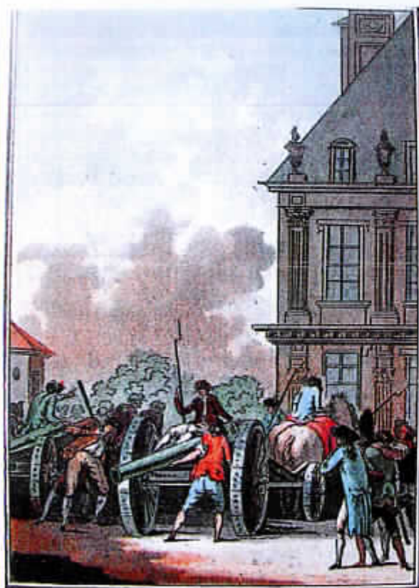
« Transport des canons des invalides dont le peuple et les bourgeois s'étaient emparés », aquatinte de Janinet, Bibl. Nat. Paris.

Comme Drouet, le maître de poste qui reconnut le roi à Varennes, comme Santerre, le brasseur du faubourg Saint-Antoine qui deviendra commandant en chef de la garde nationale, comme Elie, ce lieutenant des gardes-françaises qui fit amener des canons devant le pont-levis de la forteresse et avec qui il partage le titre de vainqueur de la Bastille, Hulin est l'un de ces personnages dont l'autorité, les actes, les paroles, ont coïncidé au bon moment avec les circonstances et que la ferveur populaire a immédiatement juché sur le piédestal de la renommée.