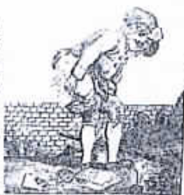
BREF. DU. PAPE. EN. 1791.

Que la raison soit notre Egide Pour conserver la liberté Et la nation notre guide Pour établir l'égalité (bis) C'est un système sans réplique Tout patriote l'avouera L'Univers entier deviendra Par la suite une République ( bis )