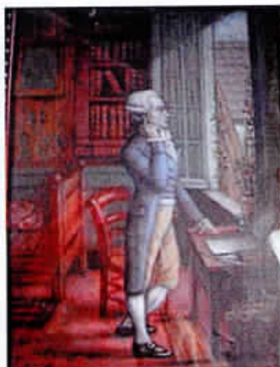
Robespierre rue St Honoré

à 17 h au 398 rue St Honoré, où il demeura chez le menuisier Duplay, jusqu'à sa mort.