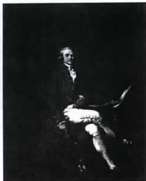
Maximilien Robespierre par Boilly. Tableau conservé au Musée des Beaux-arts de Lille

Dans l'attente d'une suite favorable à cette démarche, je vous prie d'agréer Monsieur le Sénateur-Maire, mes très respectueuses salutations.