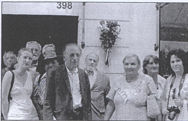
Devant le domicile de Robespierre

C'est ainsi qu'il nous interpellait à la fin d'un de ses discours contre la guerre :