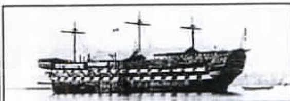
Ponton Canopus sur la rivière Marr

"Or, observera plus tard Bonaparte, nommé Premier Consul, nous avons assez peu d'Anglais chez nous, et ils tenaient beaucoup de Français chez eux." Il fut donc signifié aux Anglais que chaque nation aurait désormais à nourrir les prisonniers qu'elle aurait faits et détiendrait sur son sol.