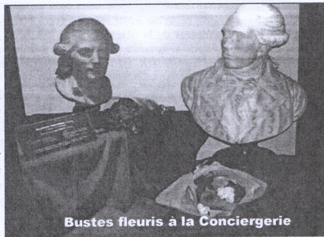
Bustes fleuris à la Conciergerie