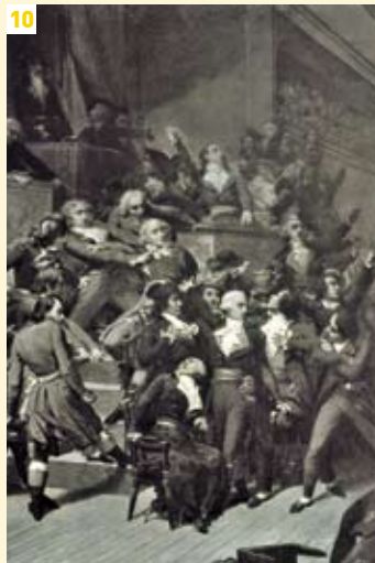
Raymond Quinsac Monvoisin (1794-1870)