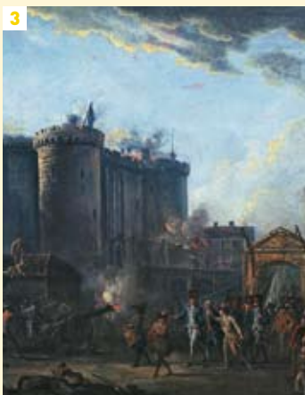
Jean-Baptiste Lallemand (1706-1803)