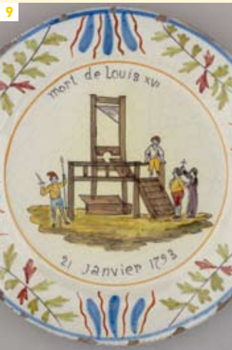
Faïence de Nevers (XIX e siècle)