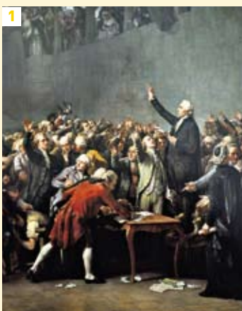
Auguste Couder (1789-1873)

■ Place à côté de la date le numéro du tableau qui illustre l'événement correspondant.