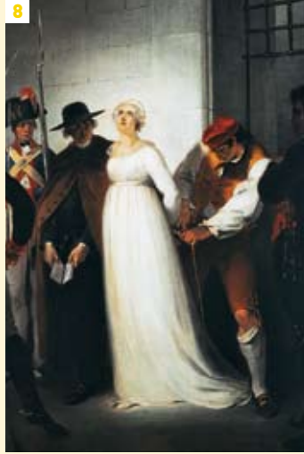
William Hamilton (1751-1801)